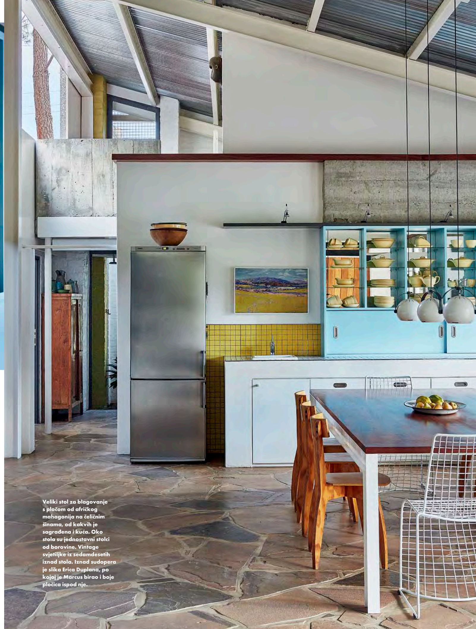
Veliki stol za blagovanje s pločom od afričkog mahagonija na čeličnim šinama, od kakvih je sagrađena i kuća. Oko stola su jednostavni stolci od borovine. Vintage svjetiljke iz sedamdesetih iznad stola. Iznad sudopera je slika Erica Duplana, po kojoj je Marcus birao i boje pločica ispod nje.